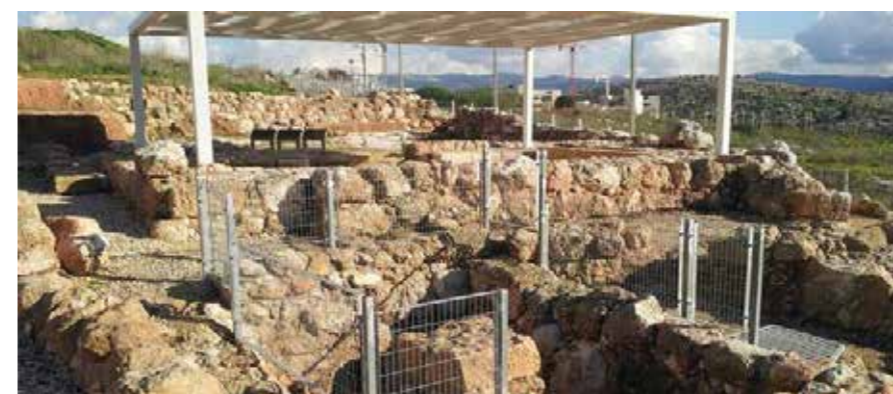
Um El Omdan