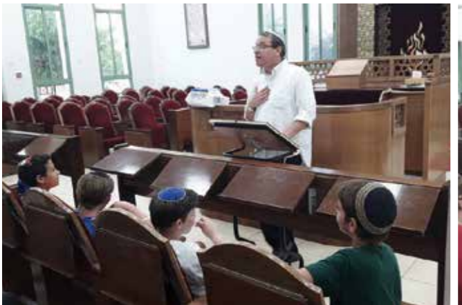
Beit Midrash para Crianças Shirat Miriam